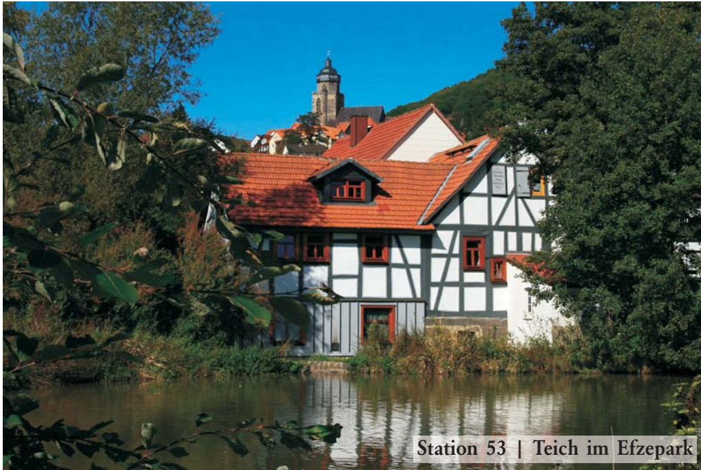
Station 53 | Teich im Efzepark

Der Spaziergang führt noch einmal durch den Efzepark. Im Rahmen des Projekts Efzevital wird der Bach in seinem Verlauf renaturiert, Auenlandschaften werden angelegt. Das Projekt ist Teil des Hessentags 2008. Es geht vorbei am Wasserspielplatz, der besonders für Kinder eine Attraktion ist.